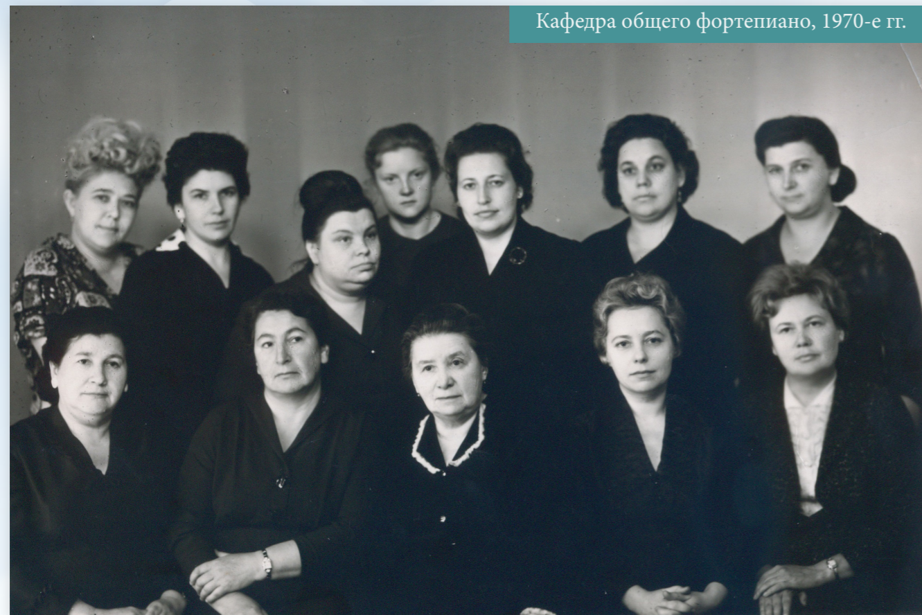
Кафедра общего фортепиано, 1970-е гг.