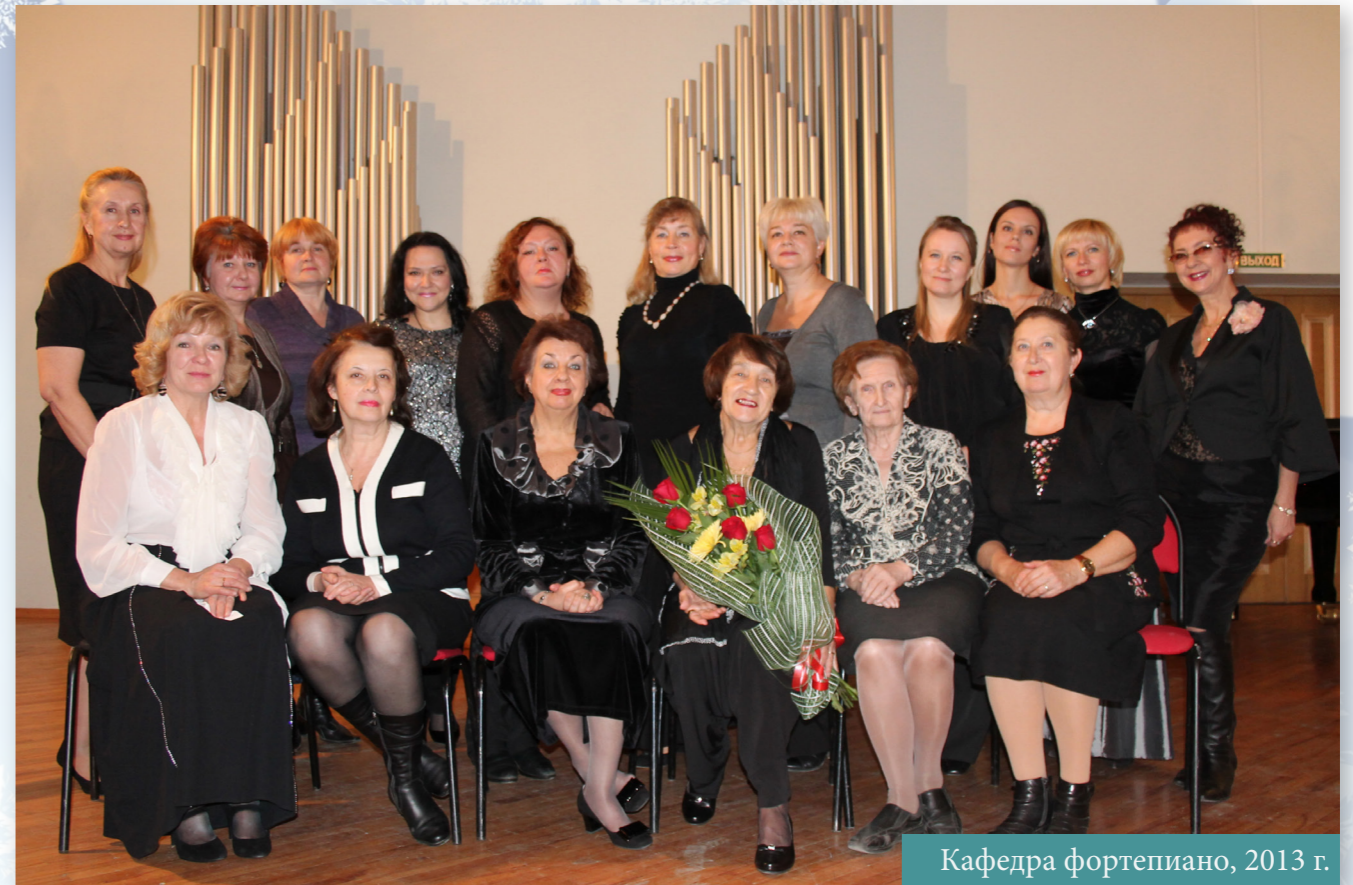
Кафедра фортепиано, 2013 г.

в качестве ансамблистов, концертмейстеров, солистов. Под руководством Наталии Николаевны стали возможными подготовка и проведение Всероссийских конкурсов по курсу фортепиано для студентов разных специальностей. На сегодняшний день их состоялось четыре.